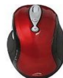
Speed Link Styx Gaming (SL-6395-SRD...