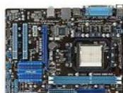
Asus M4N68T-M V2 - nForce 630a