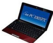
Asus Eee PC 1005PX-RED047S, červená...